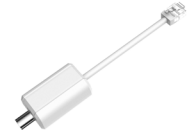
LR1002 Convertisseur ePoE sur coaxial